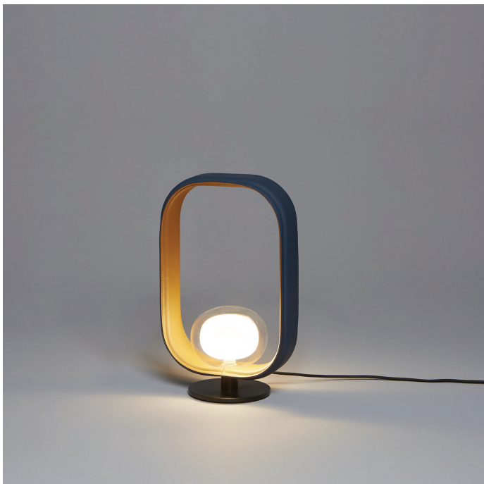
TABLE LAMP 555.31

Struttura realizzata da un fusto centrale e da una base circolare in metallo, verniciati a polveri epossidiche. La luce si diffonde attraverso un diffusore in vetro sferico in borosilicato a doppia parete Ø16. La collezione prevede anche la versione in pelle bicolore.